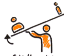
Schielagen ins Gleichgewicht